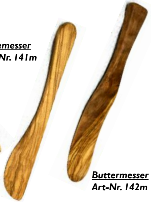
Buttermesser Art-Nr. 142m

Mit diesem Löffel drehen Sie den Honig geschickt auf, ohne den größten Teil auf Ihrem Frühstückstisch zu verteilen