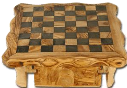
Schachspiel Klein - Art-Nr. 380s Mittel - Art-Nr. 381s Groß - Art-Nr. 382s

Wer kennt die Situation nicht. Man schneidet Brot und der ganze Tisch liegt voller Krümmel. Mit diesem Brottschneidebrett wird Ihr Tisch sauber bleiben. Die Krümmel fallen durch den Rost.