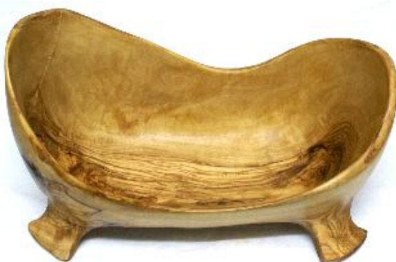
Ovale Schale mit Füßen Art-Nr. 250s 20 –50 cm