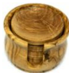
6 Untersetzer Art-Nr. 160u