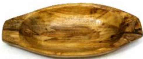
Kleine ovale Schale Art-Nr. 170s