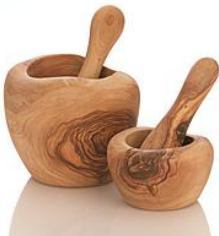
Mörser 10bis11cm- Art-Nr. 190m 12 cm- Art-Nr. 191m 13 cm- Art-Nr. 192m 14 cm- Art-Nr. 193m 14 cm- Art-Nr. 194m

Nicht nur ein Blickfang in jeder Küche, sondern auch ideal geeignet zum Zerstoßen und Zerkleinern von diversen Gewürzen und Kräutern