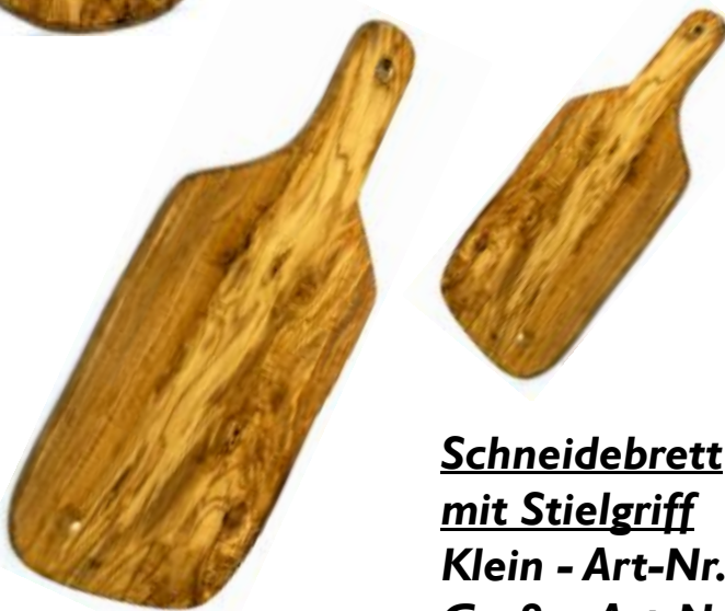
Schneidebrett mit Stielgriff Klein - Art-Nr. 300s Groß - Art-Nr. 301s

Dieses Schneidebrett aus Olivenholz eignet sich gut zum schneiden von Gemüse, Fleisch oder Fisch. Gerade großen Stücken bietet diese Brett genügend Platz.