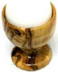
Eierbecher Art-Nr. 157e

Das Auge isst mit. Wunderschöne Eierbecher aus gedrechseltem Olivenholz.