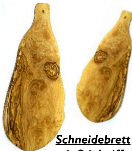
Schneidebrett mit Stielgriff Klein - Art-Nr. 300s Groß - Art-Nr. 301s