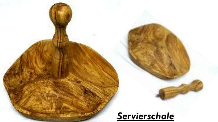
Servierschale Art-Nr. 174s