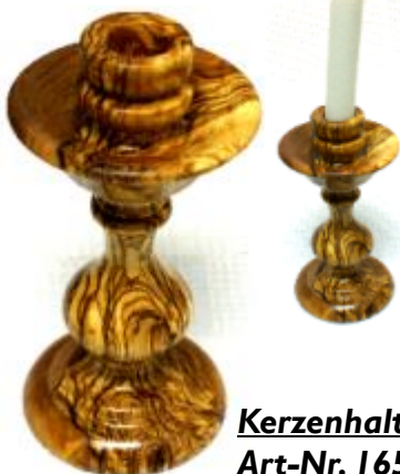
Kerzenhalter Art-Nr. 165k