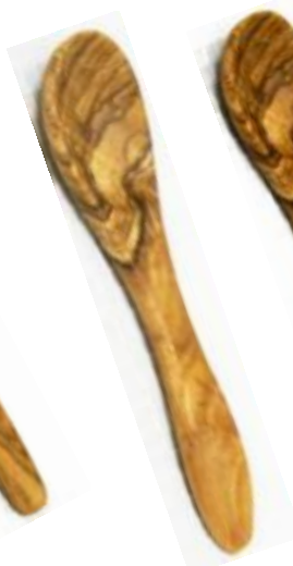
Esslöffel klein Art-Nr. 137e