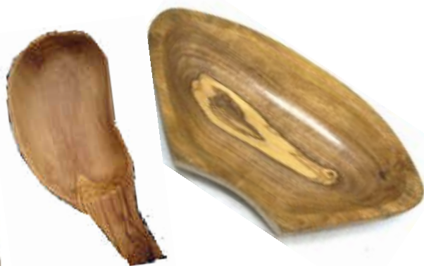
Kleine Schale Art-Nr. 172s