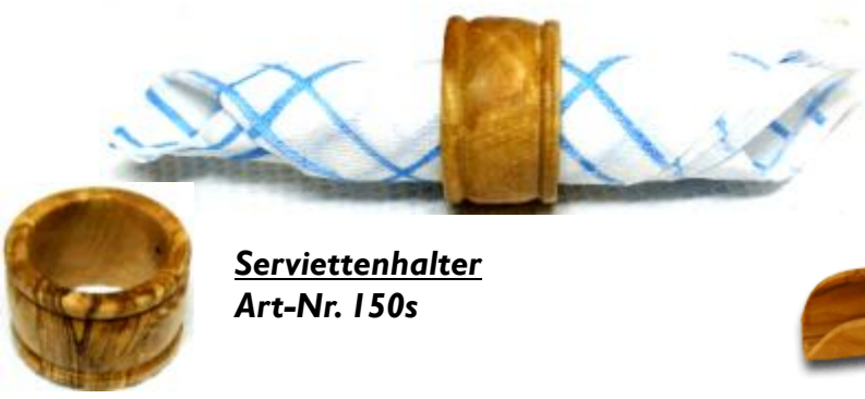
Serviettenhalter Art-Nr. 150s