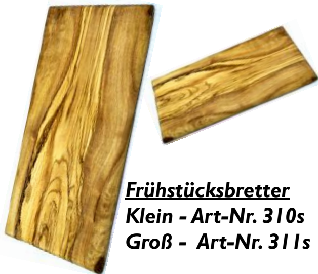
Frühstücksbretter Klein - Art-Nr. 310s Groß - Art-Nr. 311s