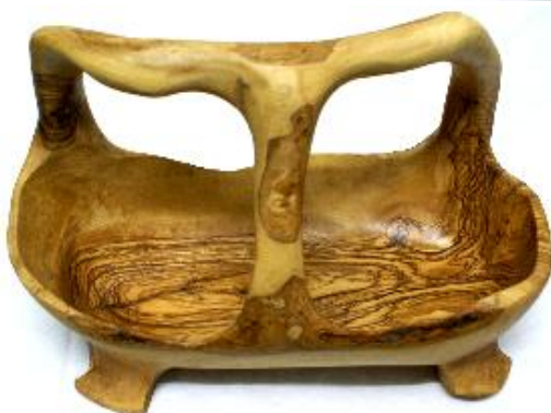
Ovale Schale mit Griff & Füßen Art-Nr. 230s 20 –50 cm