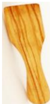
Klein Art-Nr. 132p