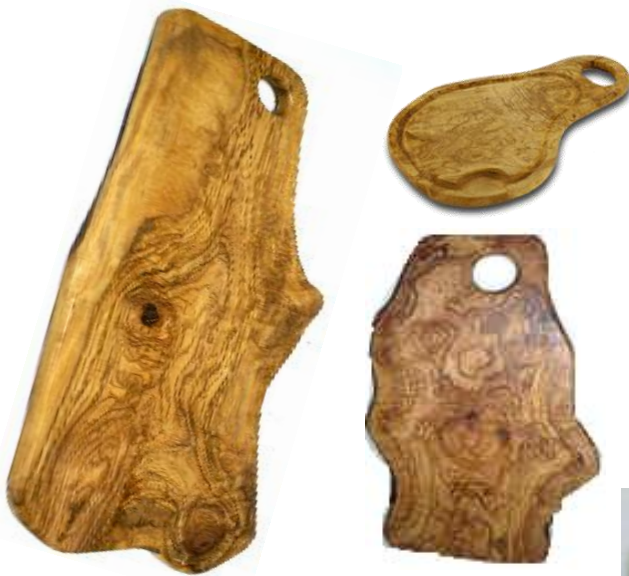
Rustikales Schneidebrett Gr. I bis 15 Art-Nr. 360s bis Art-Nr. 370s