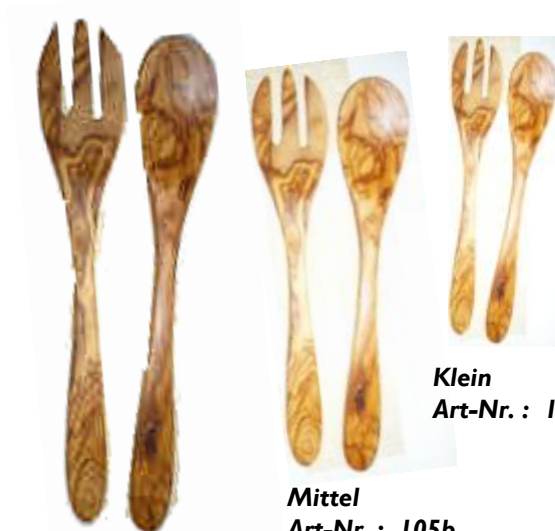
Groß Art-Nr. : 106b