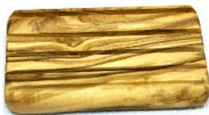
Seifenhalter Art-Nr. 173s

Nicht nur ein Blickfang in jeder Küche, sondern auch ideal geeignet zum Zerstoßen und Zerkleinern von diversen Gewürzen und Kräutern