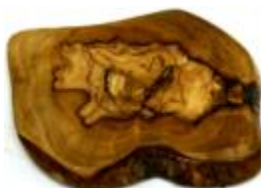
Naturbelassene Untersetzer Art-Nr. 161u