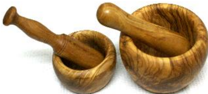
Mörser 10bis11cm- Art-Nr. 180m 12 cm- Art-Nr. 181m 13 cm- Art-Nr. 182m 14 cm- Art-Nr. 183m 15 cm- Art-Nr. 184m