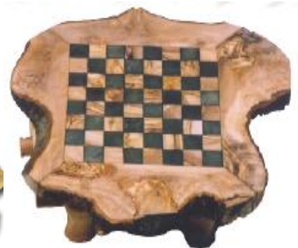
Rustikales Schachspiel Klein - Art-Nr. 385s Mittel - Art-Nr. 386s Groß - Art-Nr. 387s