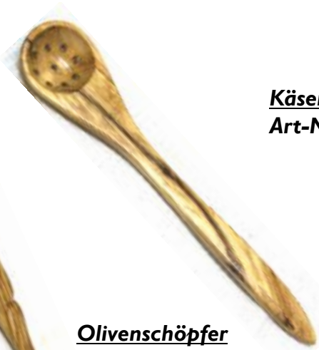
Olivenschöpfer Art-Nr. 140O