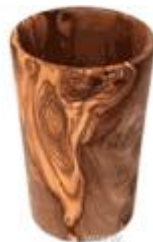
Trinkbecher klein Art-Nr. 154t