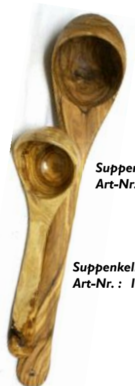
Suppenkellen Klein Art-Nr. : 124b