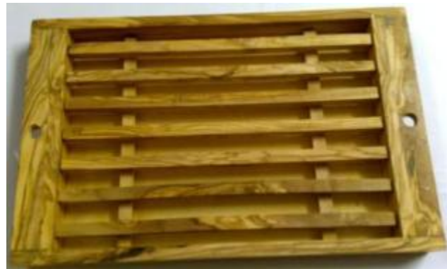
Brottschneidebrett Art-Nr. 371s

Wer kennt die Situation nicht. Man schneidet Brot und der ganze Tisch liegt voller Krümmel. Mit diesem Brottschneidebrett wird Ihr Tisch sauber bleiben. Die Krümmel fallen durch den Rost.