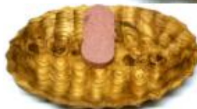
Wurstschalen Art-Nr. 210s