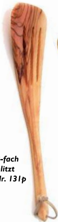
Mit 3-fach geschlitzt Art-Nr. 131p