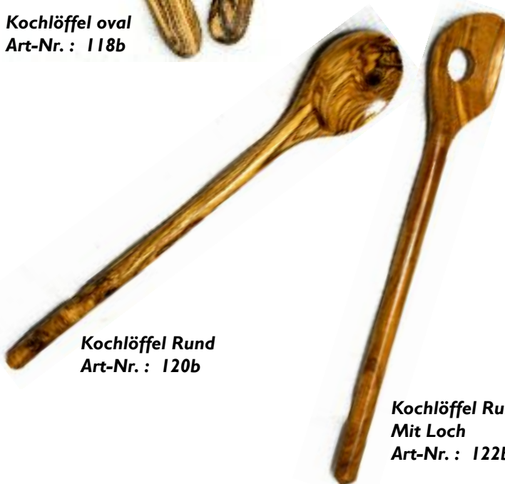
Kochlöffel Rund Art-Nr. : 120b