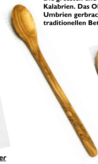
Esslöffel Art-Nr. 136e