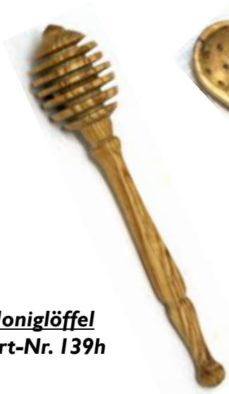
Honiglöffel Art-Nr. 139h