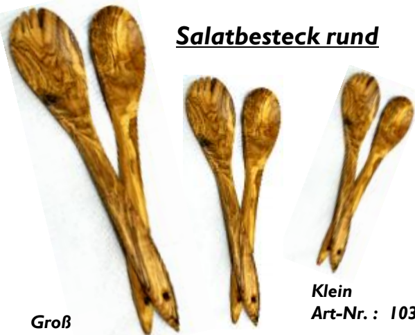
Groß Art-Nr. : 101b