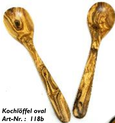
Kochlöffel oval Art-Nr. : 118b