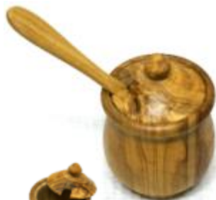
Senfdose Art-Nr. 163s