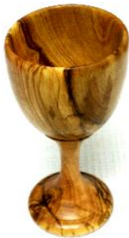
Weinbecher Art-Nr. 155w

Das Auge isst mit. Wunderschöne Eierbecher aus gedrechseltem Olivenholz.