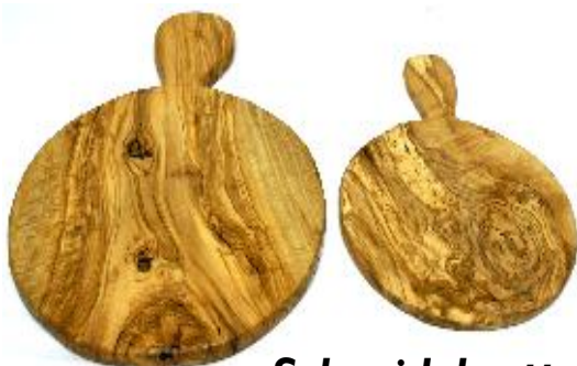
Schneidebrett mit Stielgriff Klein - Art-Nr. 330s Groß - Art-Nr. 331s