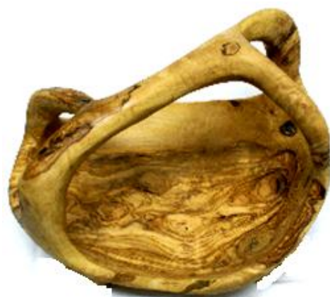
Ovale Schale mit Griff Art-Nr. 240s 20 –50 cm