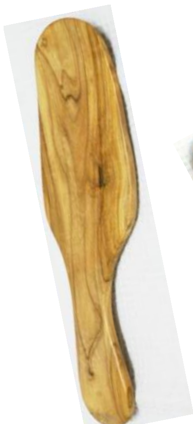
Kuchenheber Art-Nr. 135k

Interessanter Hinweis: Das Olivenholz ist wahrscheinlich das älteste Holz das im Mittelmeergebiet verwendet wurde. Es ist ein sehr widerstandfähiges Holz das nur von wenigen Produzenten aufgrund seiner Härte bearbeitet wird. Die grössten und ältesten Bäume befinden sich in Kalabrien. Das Olivenholz wird von Kalabrien nach Umbrien gebracht, fünf Jahre gelagert und in kleinen traditionellen Betrieben verarbeitet.