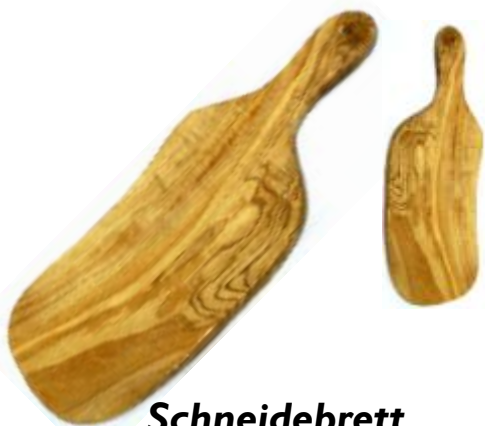
Schneidebrett mit Stielgriff Klein - Art-Nr. 320s Groß - Art-Nr. 321s