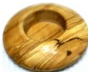
Teelichthalter Art-Nr. 164t