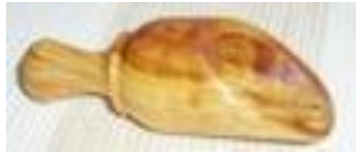
Gewürzlöffel Art-Nr. 145g

Mit diesem Löffel drehen Sie den Honig geschickt auf, ohne den größten Teil auf Ihrem Frühstückstisch zu verteilen