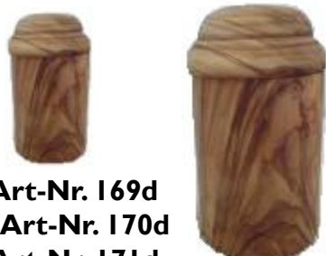
Dose Klein Art-Nr. 169d Mittel Art-Nr. 170d Groß Art-Nr. 171d