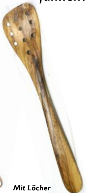
Mit Löcher Art-Nr. 130p