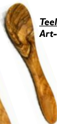
Teelöffel klein Art-Nr. 138t